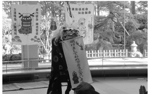
1月14日(火) 出演：安来節保存会東北支部