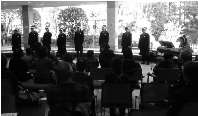
12月25日(水) 出演：仙台市立五橋中学校校合唱部