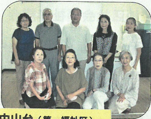
中山台（第一福社区）