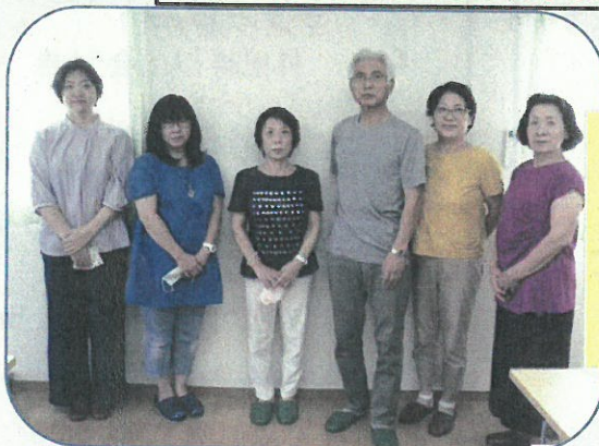
中山台西（第五福社区）