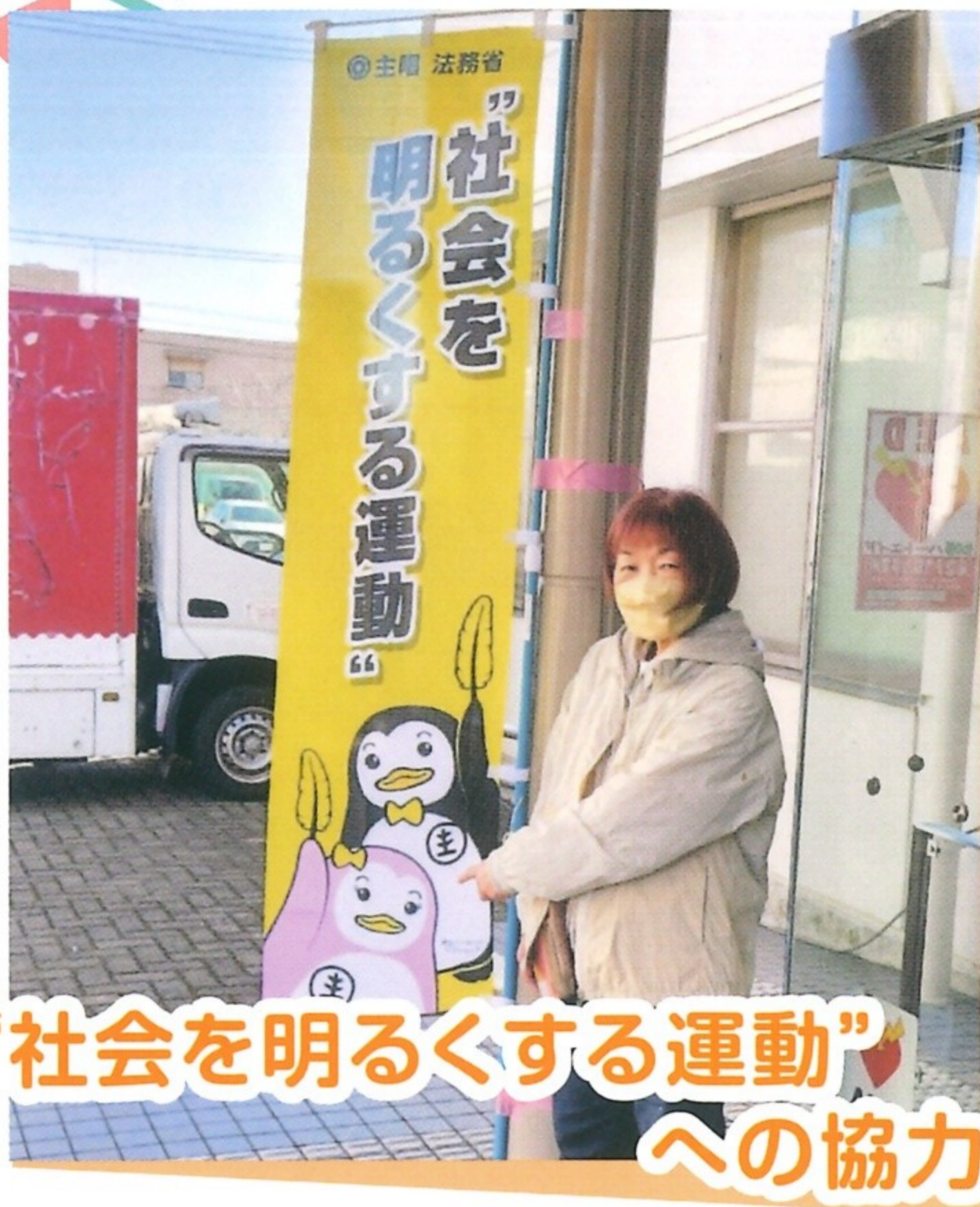
“社会を明るくする運動”への協力