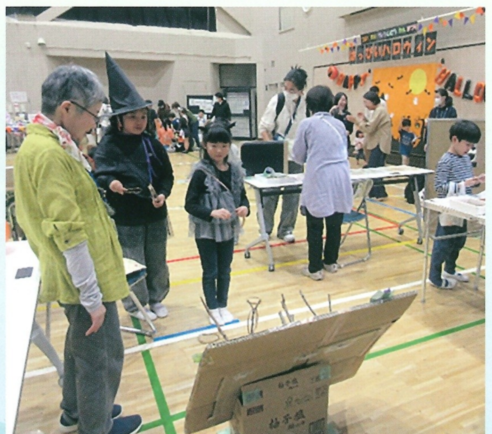
幸町児童館まつり (10月18日開催)