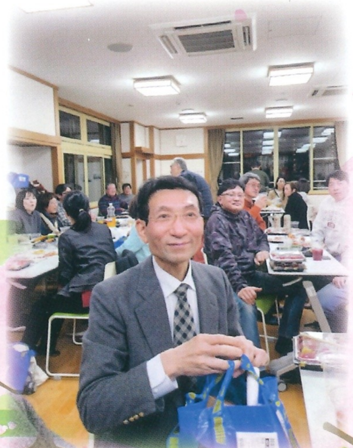
5団体新年会会場 令和8年1月18日(日)