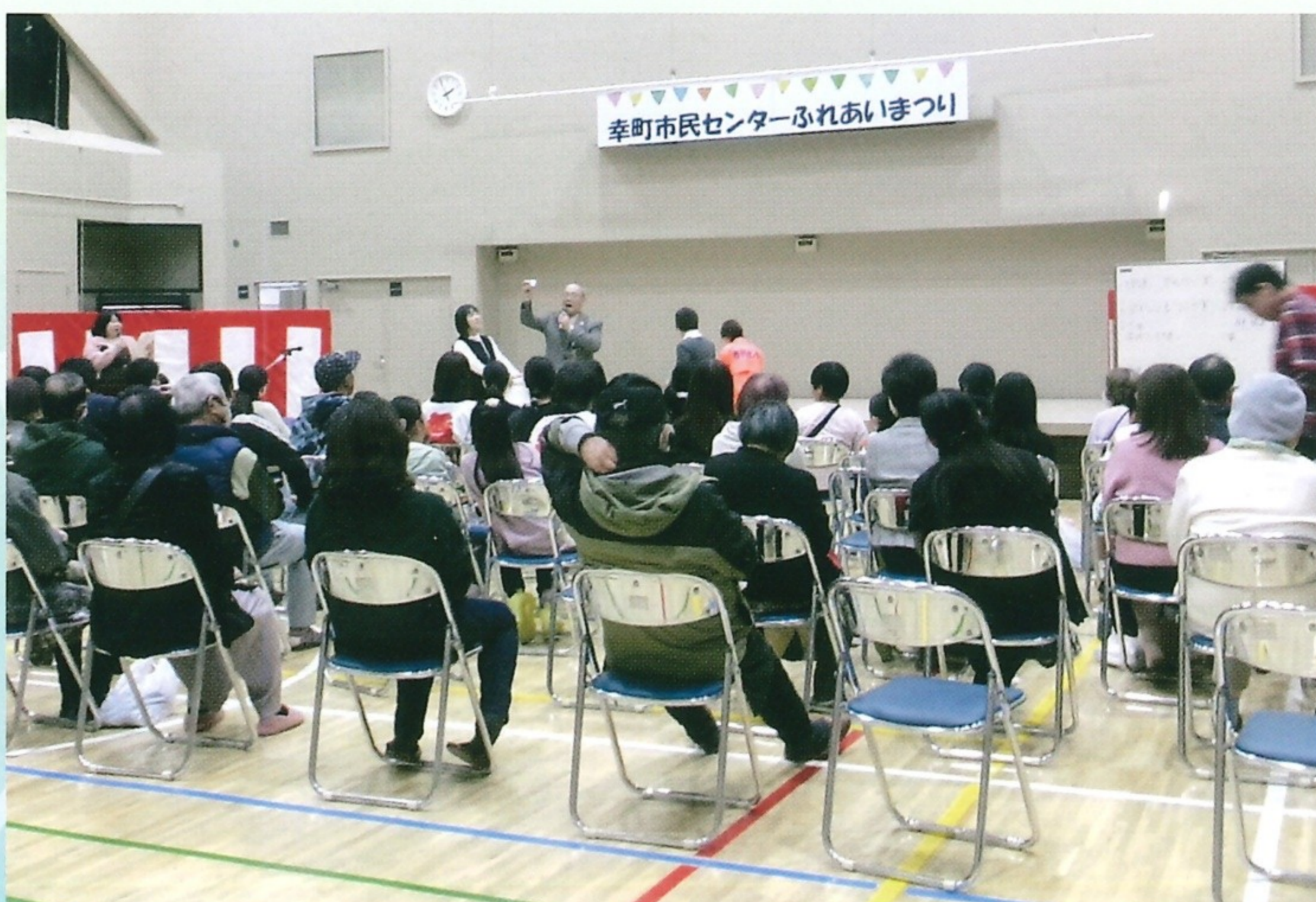
幸町市民センターふれあいまつり (11月16日)

幸町市民センター及び幸町児童館は、今後も「みんなで作る幸せの町」を目指して皆様と一緒に活動を進めてまいります。今後とも地域の皆様のご支援とご協力を、どうぞよろしくお願いいたします。