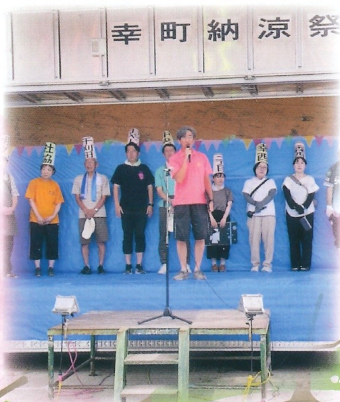
納涼祭開幕 令和7年7月27日(日)