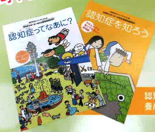
認知症サポーター養成講座の教材