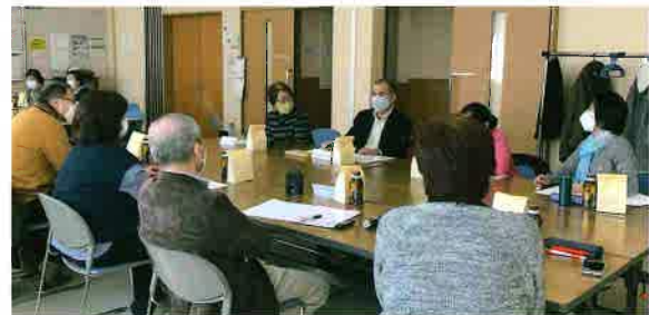
幸南地区町内会会長と福祉委員との懇談会