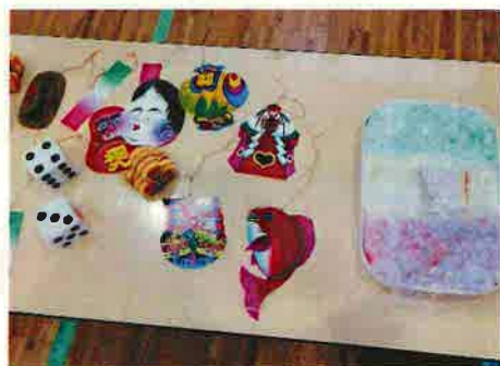
毎年、小正月行事を1月に行っています。お餅は支援委員がついて色をつけてくれました。