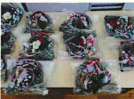
12月15日 しめ縄リース作りでした。支援委員がこのように準備し講師も務めました。