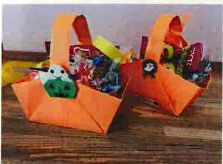
10月のばんびサロンのおみやげです。かごは支援委員が作成しました。