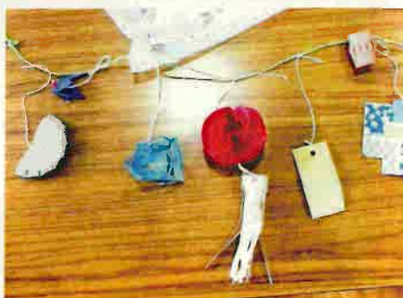
7月14日 七夕飾り作り 仙台七飾りのミニサイズです。