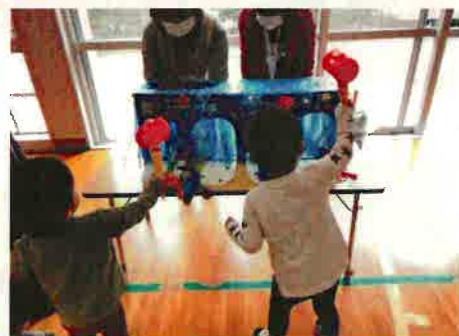
10月20日 児童センターまつりが中止になったので、お祭りごっこをしました。