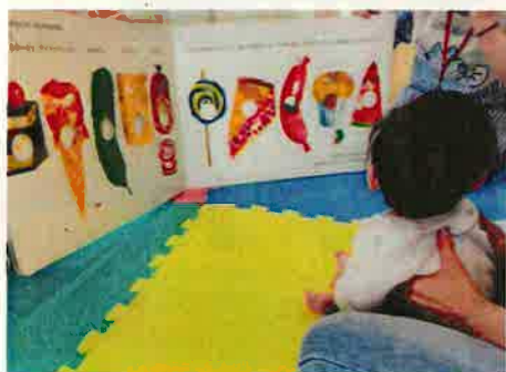
5月19日 絵本読み聞かせ 大きな絵本で大迫力です。