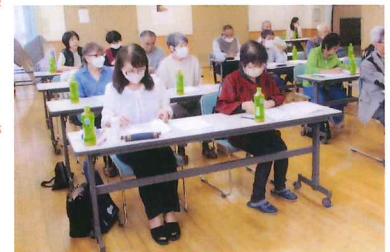
小地域福祉ネットワーク活動全体会議

5月10日の令和6年度高砂地区社協総会を経て、今年度の小地域福祉ネットワーク活動を円滑に進めるために、5月31日福室市民センターにおいてブロック長、コーディネーター、民児協会長等24名出席のもと全体会議を開催しました。会議は令和5年度の活動状況及び令和6年度の活動計画について話し合いました。特に、今年度は、「ふれあいいきいきサロン」の開催が多くなることからの確な事務処理方法について意識合わせを行いました。