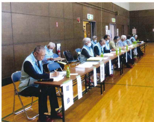
令和5年度高砂社協の役員