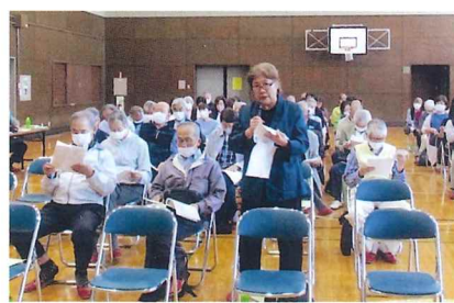
総会で議案を審議する評議員の皆様