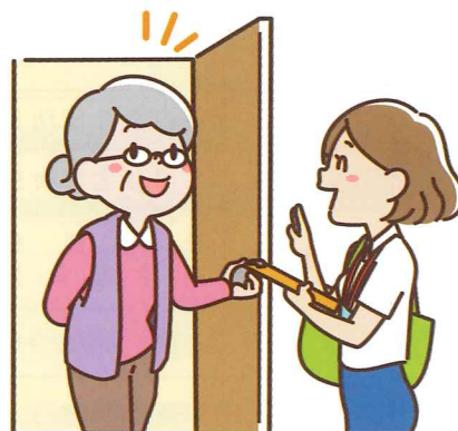
小地域福祉ネットワーク活動 (高齢者への見守り活動)