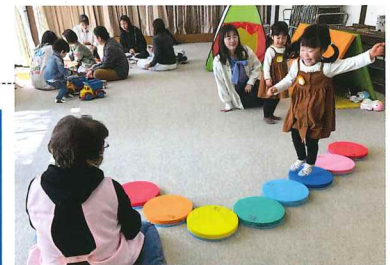
子育てサロン模様