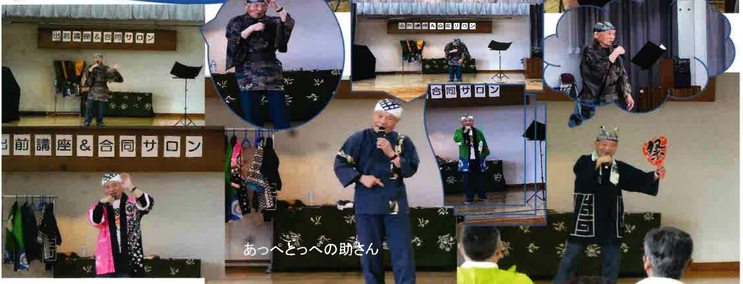
あっぺとっぺの助さん