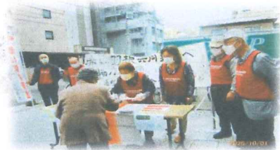
赤い羽根共同募金活動