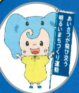
あいさつするソウくん