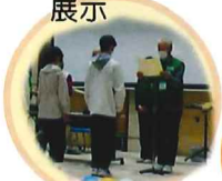
ポスター標語 表彰式