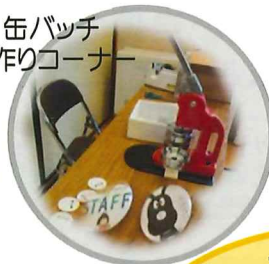
缶バッチ 手作りコーナー