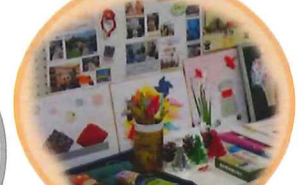
サロンなど 紹介コーナー