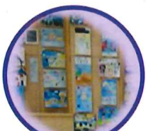
ポスター標語 展示