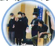
わらしべ舎みなさんの 合唱