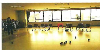
4月ポッチャを体験