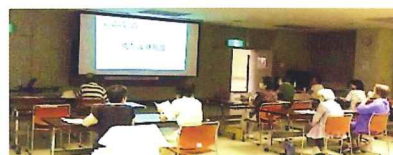
7月成年後見制度を学ぶ