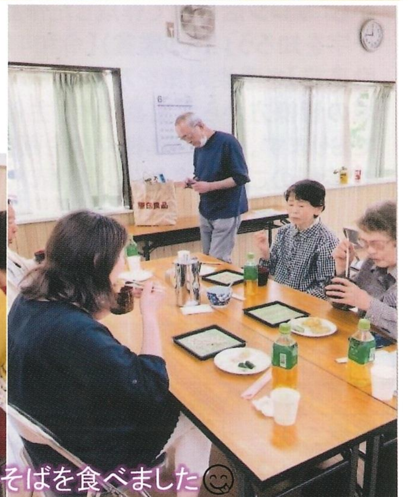
みんなで秋保の野尻そばを食べました😊