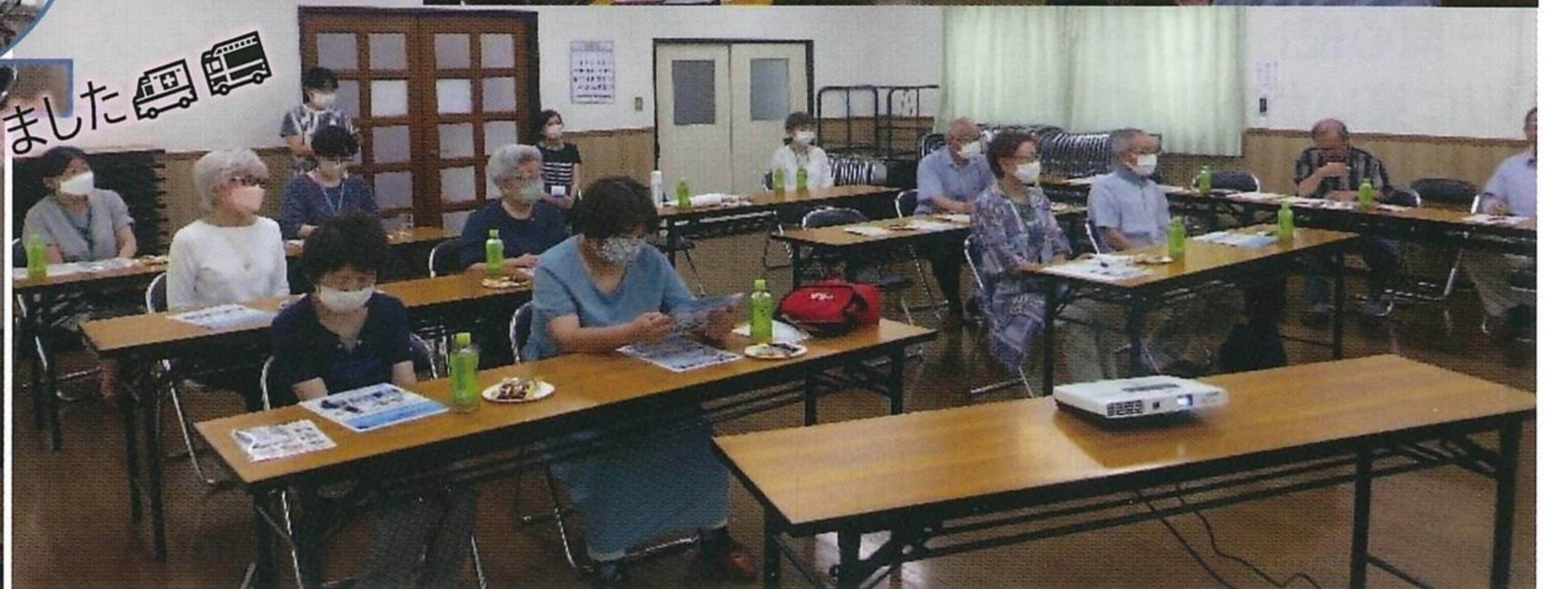
真剣に聴きました🚒🚑

今年度第一回目のいきいきサロンは、大沢広陵地域包括支援センターさんの紹介で、仙台市消防局の現役消防士さんからの緊急時対応の講話を頂きました。17名の参加者が赤坂集会所に集まり、消防車・救急車の活動の実態や、119番の通報のポイントなどのお話を聴き、また日頃感じていることの質問なども丁寧に教えて頂きました。消防士の皆さん大変ありがとうございました。