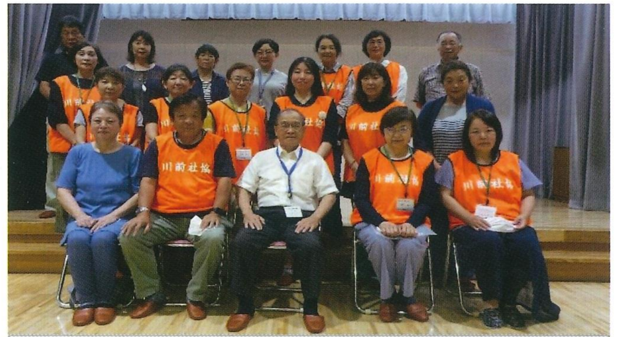
令和5年度 役員、福祉委員、民生・児童委員の皆さんです。よろしくお願いいたします。

地域の皆様には、日頃から本地区社会福祉協議会の活動にご理解とご協力をいただきありがとうございます。昨年はコロナ禍のなか、思うような活動ができませんでしたが、各地域のサロン活動をはじめ、合同サロンは「馬頭琴とホーミーの調べ」「あつぺとっぺの助 笑」「若い芽のコンサート」を開催、また小規模ながら「サロン活動にて作成した作品の展示会」と同時開催の「赤十字を知ろう」(DVD鑑賞)【令和4年度日本赤十字社奉仕団奨励事業】を感染対策を万全に行い開催することができました。地域の皆様方から大変喜ばれ、主催者側として大変うれしく思っております。今年度も様々な企画を揃えてお待ちしておりますので、皆様のご協力をよろしくお願いいたします。