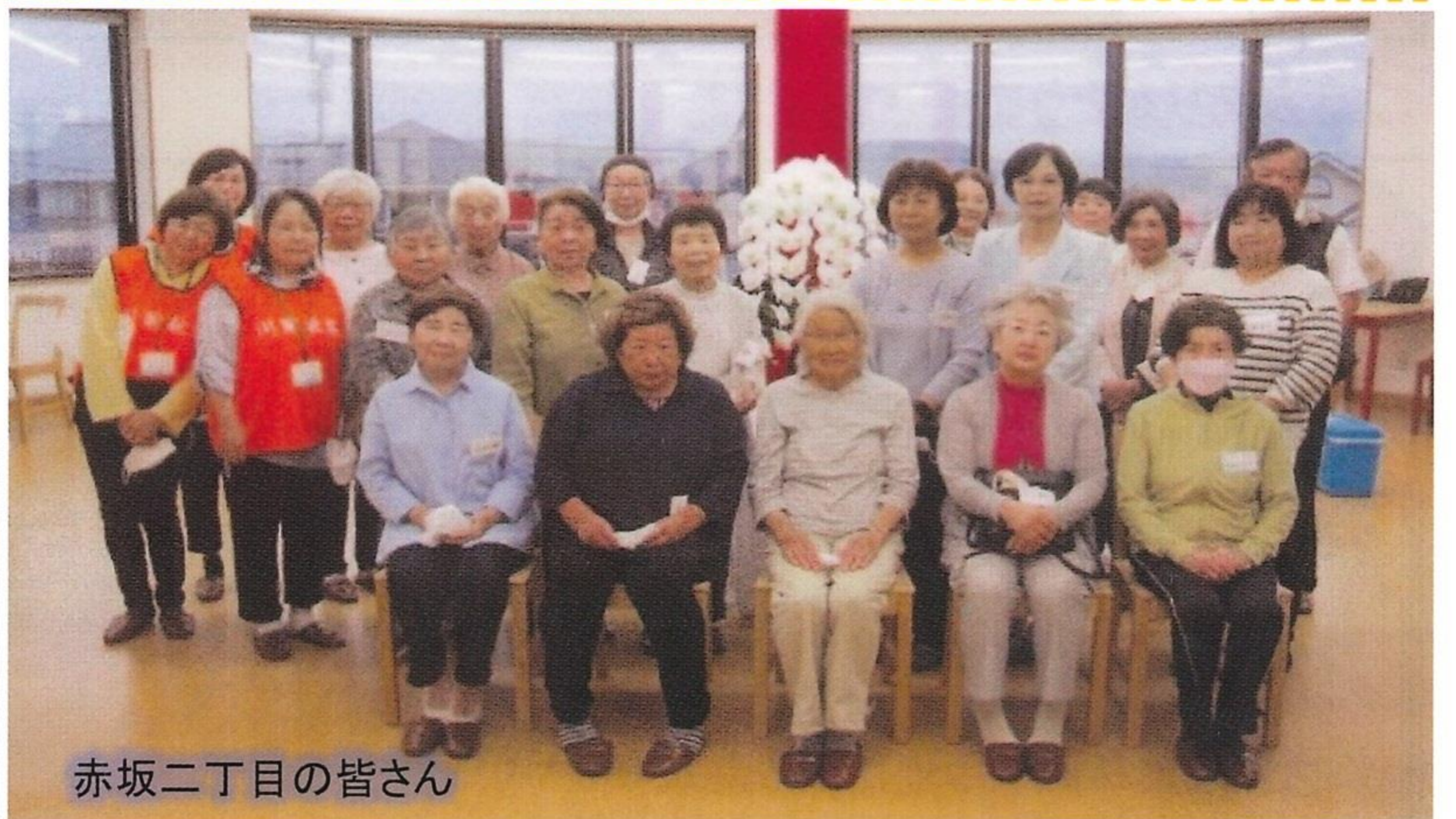
赤坂二丁目の皆さん

サロン活動としての仙台ローズガーデン訪問は4年ぶりでした。コロナ開けでの久しぶりの集いに参加者みな楽しそうに見学や歓談、寄せ植え等の体験に臨んでいました。参加費は、前回訪問時より諸般の事情で少し値上げとなりましたが、美味しいお弁当や施設の方々の笑顔の対応に一同心温まる思いで帰途につきました。