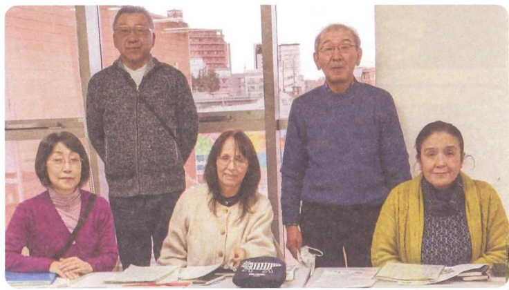
民生委員児童委員協議会 新役員スタッフ

さて、民生委員活動の大きな目的の一つに地域福祉の向上が挙げられます。常日頃から住民の皆様の身近な相談相手となり、必要な支援や情報提供を行い、行政や関係機関と連携しながら問題解決に努めることで福祉の向上を目指しているのです。また、身近な地域の福祉活動や見守り活動も積極的に行いながら、誰もが安心して暮らせるまちづくりに貢献していけるよう委員一同努めておりますので、今後ともどうぞよろしくお願いいたします。