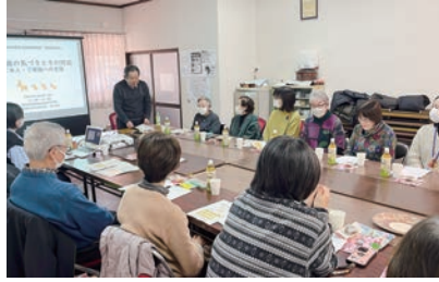
日頃の挨拶や声かけの大切さを再確認！

この日は、「認知症の方が増えてきた、どのように対応したら良いだろうか」という地域の声をきっかけに開催された、八木山南地区の住民座談会に参加してきました。専門家の講話に加え、認知症になっても安心して暮らせるまちづくりのため、見守りや声掛けの方法について意見交換をしました。