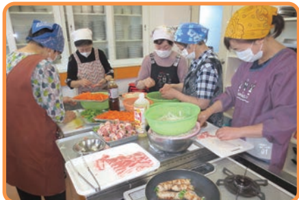
▲ 手作りのお弁当を調理♪

年に1〜2回実施している配食活動では、75歳以上の一人暮らし高齢者の方に、季節の折り紙を添えてお弁当をお届けしており、大変喜ばれています。 コロナ禍以降、手作りのお弁当をお届けすることが難しく、