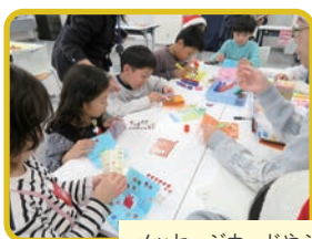
メッセージカードやシュートレン作りに挑戦！ 福笑いや輪投げなど楽しい遊びが盛りだくさん♪

令和8年度も開催予定です。区事務所SNS（本紙8ページに記載）等でお知らせしていきます。