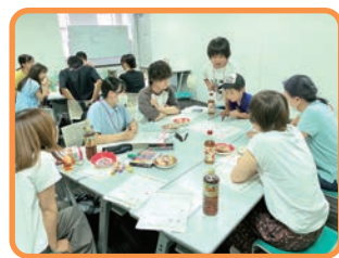
▲ 企画会議の様子 多世代でわいわいと楽しくアイデアを出し合っています♪

これまでに企画会議を4回開催し、カードゲームをより楽しむための工夫や、お題となるライフイベントやエピソードのアイデア