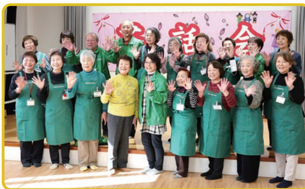
▲若林地区社協のイメージカラーは「みどり」！ジャンパーやエプロンをそろえ、心ひとつに活動しています。