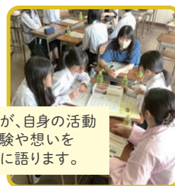
大学生が、自身の活動での体験や想いを高校生に語ります。

それぞれが得意分野や経験を生かし、世代を超えたチームワークで、温かみのある催しとなり、ボランティア活動初参加の方も、地域や他のボランティアとつながる貴重な機会となりました。