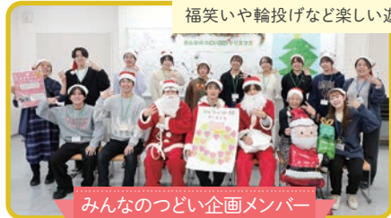
みんなのつどい企画メンバー