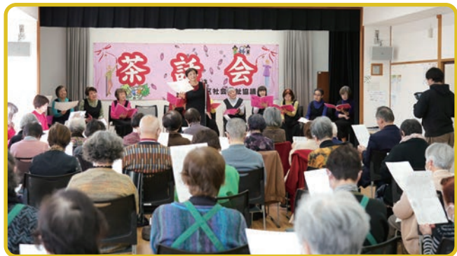
▲「るるるん♪ハーモニー」の皆さんの合唱にあわせて、童謡メドレーを一緒に歌いました♪

立上げ当初から、毎月趣向を凝らした出し物を用意し、最近では、オカリナ演奏、腹話術、フラダンス、落語、舞踊など、さまざまなジャンルの催しを楽しんでいます。