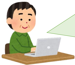
支援員 A さん (男性 60代)