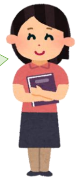
支援員 B さん (女性 50代)

利用者様の希望を全てかなえることが難しくても、お気持ちを確認して担当の専門員につないでいく、その後、利用者様の生活が整い、笑顔になっていく場面に関わることが自分のことのようにうれしく思います。